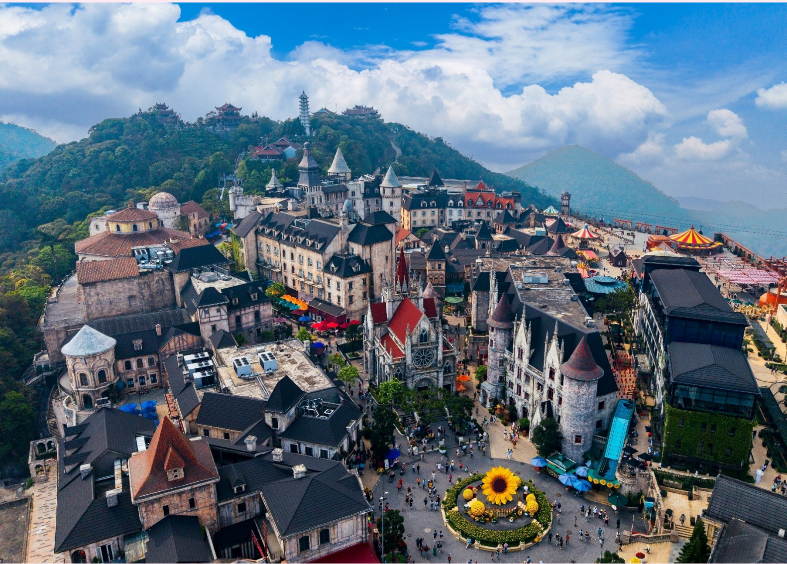
ยังยอดเขา

นำท่านนั่งกระเช้าขึ้นสู่เมืองตากอากาศขึ้นชื่อแห่งเมืองดานัง บานาฮิลล์ (Bana Hills) บานาฮิลล์เป็นแหล่งท่องเที่ยวตากอากาศมาตั้งแต่สมัยสงครามโลกครั้งที่ 1 โดยเกิดแนวคิดการสร้างบ้านพักและโรงแรมจากชาวฝรั่งเศสสมัยอาณานิคมตั้งแต่ปี 1919 หลังจากจบสงครามฝรั่งเศสได้พ่ายแพ้และเดินทางออกจากเวียดนามเพื่อกลับประเทศ ทำให้บานาฮิลล์ถูกทิ้งร้างมาเป็นเวลานาน รัฐบาลเวียดนามได้บูรณะเป็นเมืองท่องเที่ยวตากอากาศแห่งนี้อีกครั้งในปี 2009 พร้อมกับได้มีการสร้าง กระเช้าลอยฟ้าเพื่อใช้เป็นเส้นทางสำหรับขึ้นไป