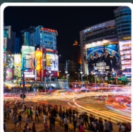
ตลาดกลางคืนซีเหมินติง