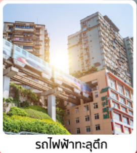
รถไฟฟ้าทะลุคิ๊ง