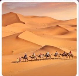
ทะเลทรายเสียนชวาน

• โฮลไค้ เนินทรายเสียนชวาน แหล่งท่องเที่ยวระดับ 5A ภูเขาไฟอูลันฮาตา พิพิธภัณฑ์ภูเขาไฟตามธรรมชาติ