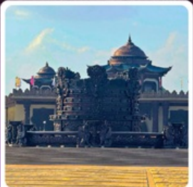
ศูนย์วัฒนธรรมหยวนหยิว