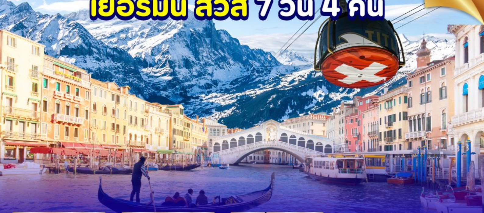
ยอดเขากิตลิส