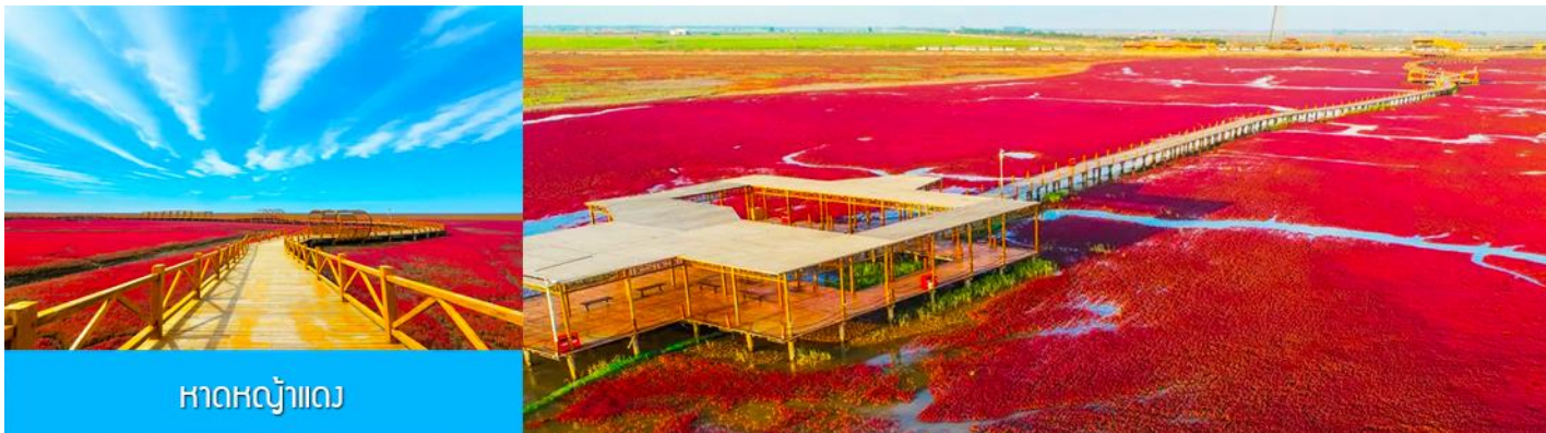
หาดหญ้าแดง

หลังอาหารนำท่านเดินทางสู่ เมืองผานจิน 盘锦 (ระยะทาง 170 กม. ใช้เวลาเดินทางราว 2 ชั่วโมงเศษ)