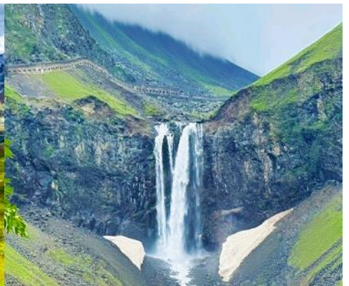
ภูเขาฉางไป๋ซาน

หลังอาหารนำท่านเที่ยวชม ยอดเขาฉางไป๋ซาน 长白山 (ขึ้น/ลงเนินด้านทิศเหนือ) ชมความงามที่เร้นลับของ ทะเลสาบเทียนจื่อ 天池 ที่เชื่อกันว่าเป็นแหล่งน้ำศักดิ์สิทธิ์ที่อยู่ใกล้สวรรค์จนเป็นที่มาของคำว่าเทียนจื่อที่แปลว่าทะเลสาบบนสวรรค์ ชม น้ำตกเขาฉางไป๋ซาน 长白山瀑布 เป็นน้ำตกที่ไหลลงมาจากหน้าผาขนาดใหญ่ที่มีความสูง 68 เมตร น้ำตกแห่งนี้เป็นจุดน้ำไหลออกของทะเลสาบเทียนจื่อ และเป็นต้นกำเนิดของแม่น้ำซางฮัวเจียง....ชม สระน้ำมรกต 绿渊潭 สระน้ำสีเขียวมรกตที่มีน้ำตกน้อยสองสายที่คอยเติมน้ำเข้าไปในสระ เป็น