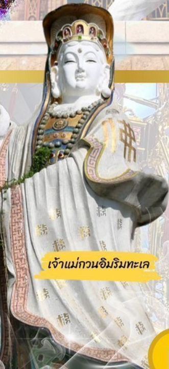
เจ้าแม่กวนอิมวิมทะเล