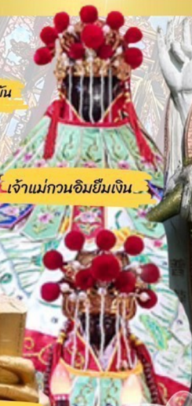
เจ้าแม่กวนอิมฮิมเงิน