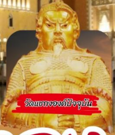
วัดแบกองค์ปัจจุบัน