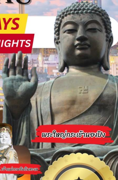
พระใหญ่กระเข้านองปิง