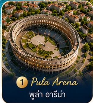
1 Pula Arena พูลา อาร์น่า