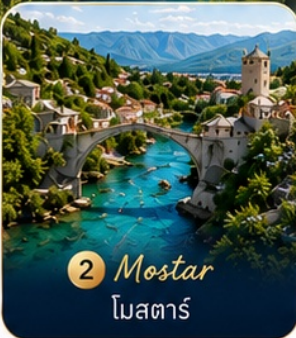
2 Mostar โมสตาร์