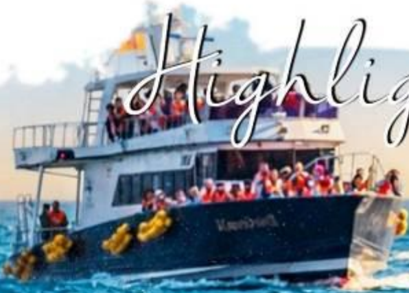
RAUSU WHALE CRUISE