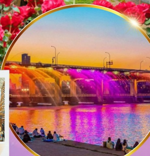
ชมสะพานน้ำพุสายรุ้ง