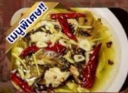
ปลาต้มพริกทอด