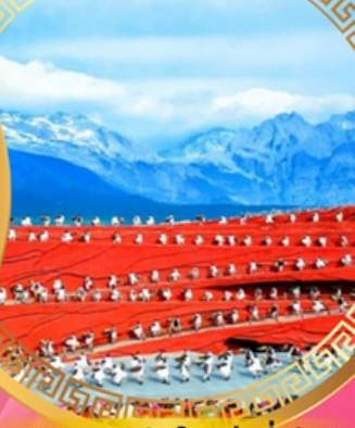
ความประทับใจแห่งลี่เจียง