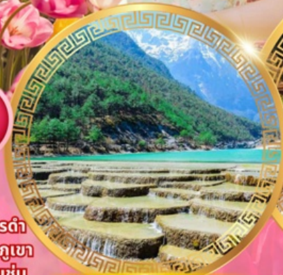
ทะเลสาบไป๋สยเหอ

เมืองโบราณคู่เสียง เมืองโบราณต้าหลี่ เจดีย์สามองค์ เมืองโบราณแสงกริลล่า วัดชงจ้านหลิน ช่องแคบเสือกะโจน สระมังกรดำ เมืองโบราณลีเจียง ภูเขาหิมะมังกรหยก ชมวิวภูเขา หิมะที่ร้าน Yun di ta ชมดอกไม้ที่สวนอุทยานชุ่ม น้ำโกวหนาน ชมดอกซากุระสวนหยวนทง