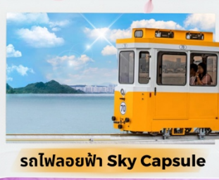
รถไฟลอยฟ้า Sky Capsule