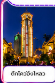
ตึกโควอชิงไหลว