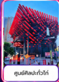
ศูนย์ศิลปะแก้วโก