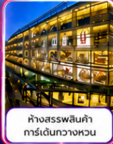
ห้างสรรพสินค้า การ์เด็นกวางหวน