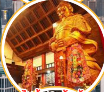
ไหว้พระวัดดั่ง