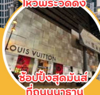
ช้อปปิ้งสุดมันส์ ที่ถนนนคราณ