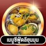
เมนูซีฟู้ดลิ้นจี่