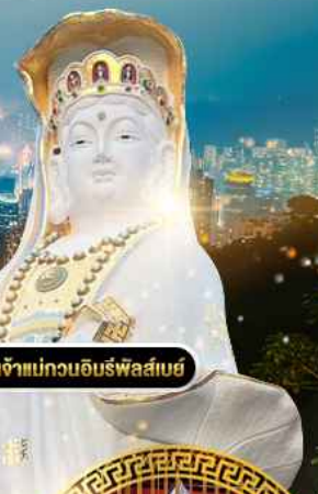
วัดเจ้าแม่กวนอิมฟ้าใส