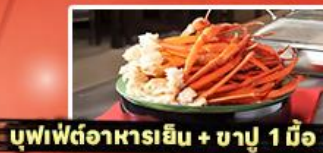
บุฟเฟ่ต์อาหารเย็น + ชาปู 1 มื้อ

รหัสทัวร์ RJ-XJ134 เดินทาง 5D 3N ก.ย. - ต.ค. 2569