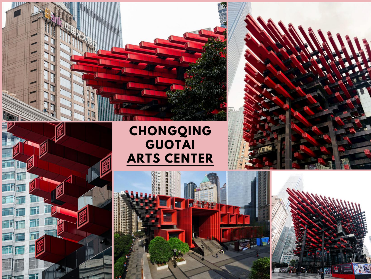
CHONGQING GUOTAI ARTS CENTER

จากนั้นนำท่านสู่ ตึกตะเกียบ (Chongqing Guotai Arts Center) แลนด์มาร์กดีไซน์ล้ำสมัย เป็นสิ่งก่อสร้างอันมีเอกลักษณ์ อาคารนี้ถูกออกแบบให้มีรูปร่างคล้ายกอง “ตะเกียบยักษ์” สีดำ และแดงที่วางซ้อนกันเป็นชั้น ๆ สร้างความประทับใจให้กับผู้พบเห็นตั้งแต่แรกเห็น นอกจากนี้จะเป็นสัญลักษณ์ที่โดดเด่นแล้ว ยังเป็นศูนย์รวมงานศิลปะที่สำคัญ มีการจัดแสดงนิทรรศการศิลปะหลากหลายประเภท ทั้งภาพวาด ประติมากรรม และการแสดงต่าง ๆ สะท้อนถึงความคิดสร้างสรรค์ และการผสมผสานระหว่างวัฒนธรรมจีนดั้งเดิมกับความทันสมัยได้อย่างลงตัว ตึกตะเกียบจึงเป็นสัญลักษณ์แห่งความภาคภูมิใจ ความเป็นเอกลักษณ์ของเมืองฉงชิ่งที่นำมาเยือน และชื่นชมอย่างยิ่ง