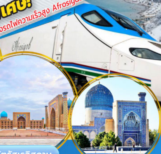
จัตุรัสเรจิสถาน