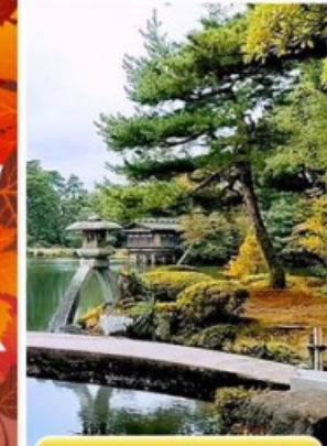
วัดไดชิซังเซโด้จิ