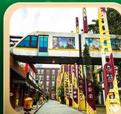
“ตงเจียวจี้”