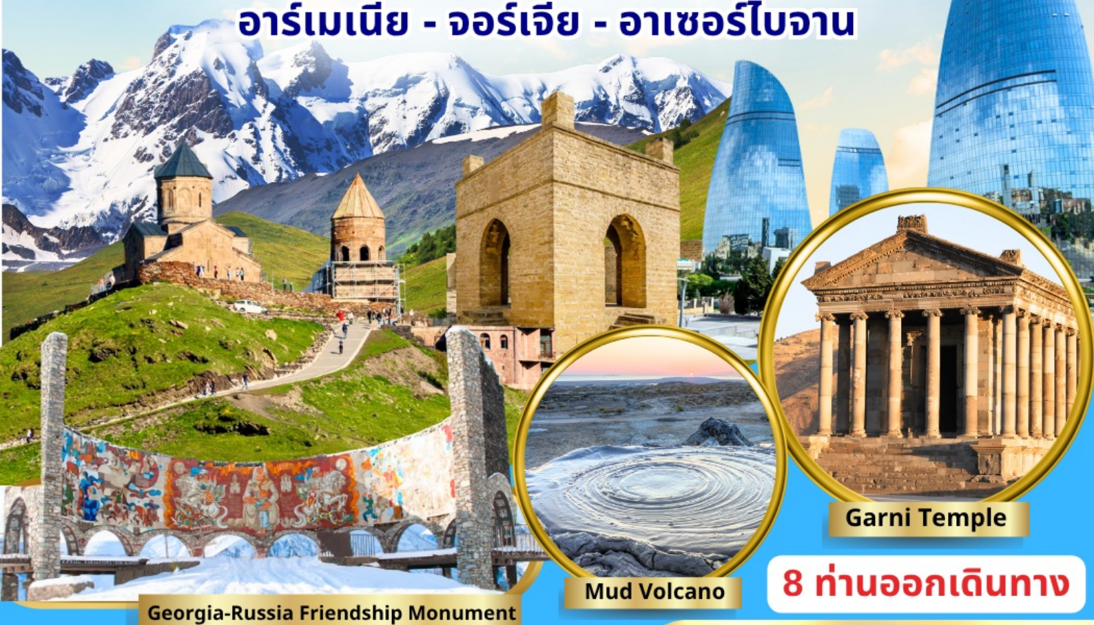
Georgia-Russia Friendship Monument