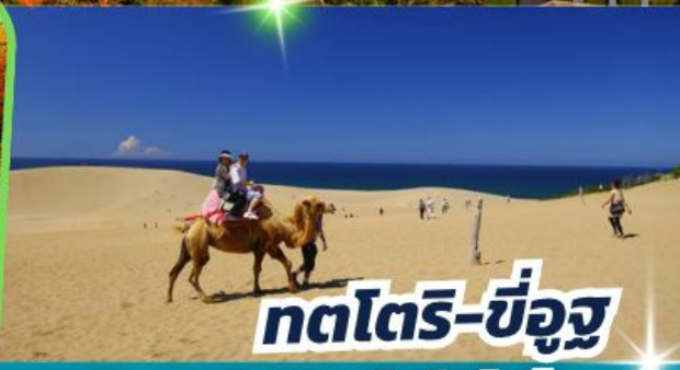
ทตโตริ-ซึอูจึ