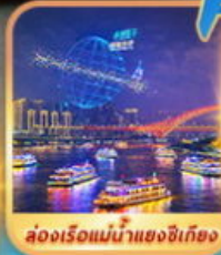
ล่องเรือแม่น้ำแยงซีเกียง