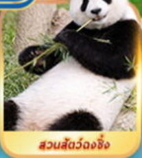
สวนสัตว์จงชิ่ง