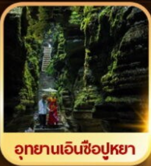
อุทยานเอ็นชือปูหย่า