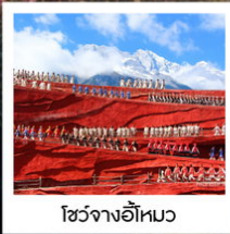
โซ่วจางอีไห่