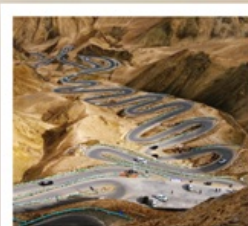
ถนนโบราณผานหลง