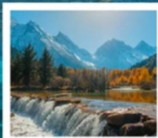
อุทยานปี่ผิงโกว