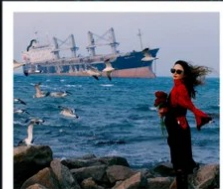
เรือควิวส

หอคอยกาลเวลา / รูปปั้นปลาวาฬ / ถนนโบราณเตาหยาง / ย่านสงไห่ 1920 / เมืองเว่ยไห่ / ถนนฮิวจวิปา / จตุรัสประตูแห่งความสุข ย่านอันลอฟาง / เรือควิวส / หาดซาจื่อฮั่ว / ถนนหลงเจียง / สะพานจันเจียว / หาดไซเบอร์ No. 3 ถนนจงซาน / โบสถ์ St.Emill / จตุรัส 54 / ศูนย์เรือใบโอลิมปิก / พิพิธภัณฑ์มิสเตอร์ชิงเต่า / ถนนโตตง / ท่าเรือประมงเหียนโก