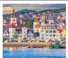
ท่าเรือประมงเหียนโก