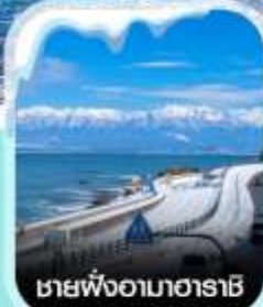
ชายฝั่งอามาฮาราชิ