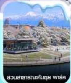
สวนสาธารณะคันซุย พาร์ค

✈️ คอนเฟิร์มออกเดินทาง ทุกพีเรียด 2 ท่านขึ้นไป