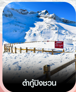
ต้ากู่ปิงชอน