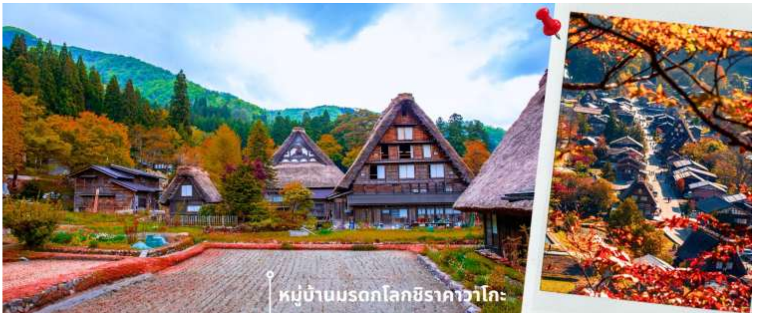
หมู่บ้านมรดกโลกชิราคาวาโกะ

จากนั้นนำท่านเดินทางสู่ เมืองกิฟุ พาท่านเข้าชม หมู่บ้านมรดกโลกชิราคาวาโกะ หมู่บ้านแห่งนี้ ตั้งอยู่ในหุบเขาสูงห่างไกลความเจริญ ทำให้ยังรักษาขนบธรรมเนียม ประเพณีอันดั้งเดิมไว้ได้อย่างสมบูรณ์ และเป็นหมู่บ้านที่มีรูปร่างแปลกตาติดอันดับ ซึ่งได้ชื่อว่าเป็น The most beautiful village in Japan โดยมีบ้านทรงแบบ “กัสโซสิคิริ” ซึ่งเป็นบ้านชาวนาโบราณที่มีอายุมากกว่า 250 ปี คำว่า กัสโซ มีความหมายว่า พนมมือ ซึ่งคล้ายกับรูปแบบของบ้านที่มีหลังคามุงด้วยฟางข้าวที่ทำมุมชันถึง 60 องศา ราวกับสองมือที่ประนมเข้าหากัน ตัวบ้านมีความยาวประมาณ 18 เมตร กว้าง 10 เมตร ทั้งหลังถูกสร้างขึ้นโดยไม่ใช้ตะปู ภายหลังจากในปี 1995 ได้รับการตั้งขึ้นเป็นมรดกโลก