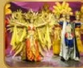
ชมการแสดงโขน