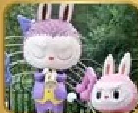
เที่ยวสวนสนุก