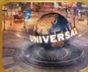
เที่ยวสวนสนุก