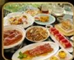
อาหารจีน เริ่มต้น TAO TAO JU