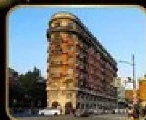
ภัตตาคาร เริ่มต้น WUKANG MANSION