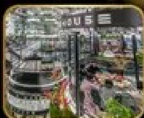
ภัตตาคาร เริ่มต้น WAREHOUSE NO.3