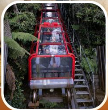
อุทยานบลูเมาท์เท็นส์