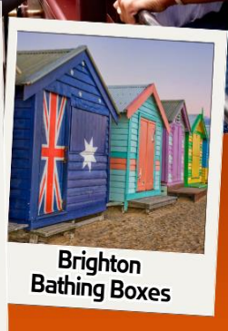
Brighton Bathing Boxes

1 - 5 เม.ย. / 29 เม.ย. - 3 พ.ค. 69 27 - 31 พ.ค. 69