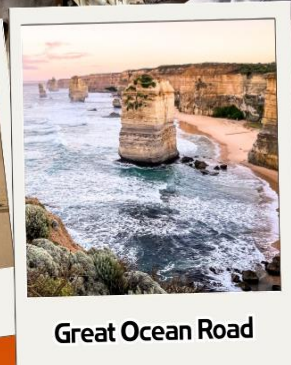
Great Ocean Road