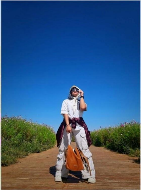
ทุ่งหญ้าออร์ดอส (Ordos Prairie)