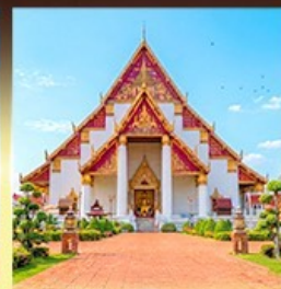
วิหารพระมงคลมถิต