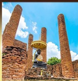
วัดธรรมิกราช