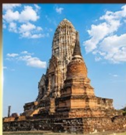
วัดราชบูรณะ