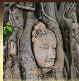
วัดมหาธาตุ