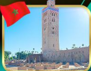
มัสยิดคูตูเบีย มาราเกช