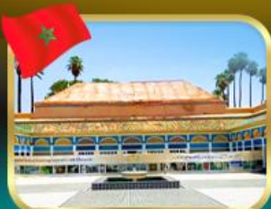
พระราชวังบาเฮีย