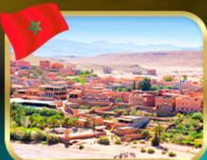
เมืองไอก์ เบนฮัดดู