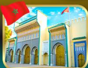
ประตูพระราชวังหลวง