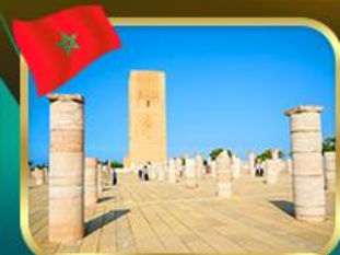
หอคอยอัลซัน ราบัต