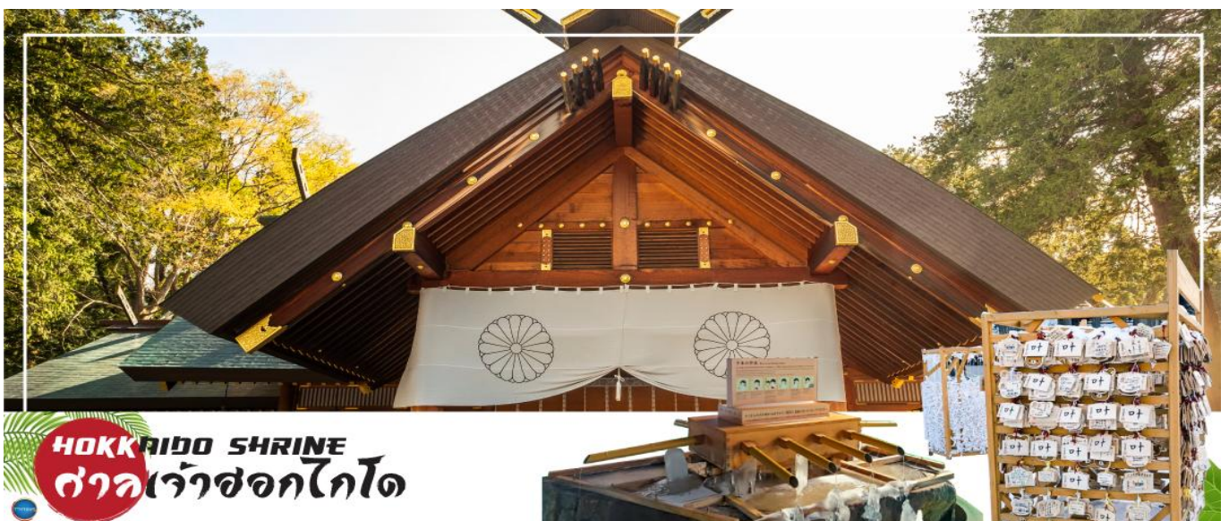
HOKKAIDO SHRINE ศาลเจ้าฮอกไกโด

นำท่านขอพร ศาลเจ้าฮอกไกโด (Hokkaido Shrine) หรือเดิมชื่อ ศาลเจ้าซัปโปโร เปลี่ยนเพื่อให้สมกับ ความยิ่งใหญ่ของเกาะเมืองฮอกไกโด ศาลเจ้าชินโตนี้คอยปกป้องรักษาให้ชนชาวเกาะฮอกไกโดมีความสุขถึงแม้จะไม่ได้มีประวัติศาสตร์อันยาวนาน