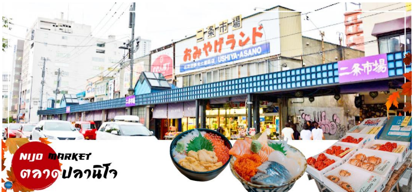
NIJO MARKET ตลาดปลาชิโง

จากนั้นนำท่านเดินทางสู่ เมืองซัปโปโร (SAPPORO) (ใช้เวลาเดินทางประมาณ 1 ชั่วโมง) เพื่อนำท่านสู่ ตลาดปลาชิโง (Nijo Market) ตลาดปลาใจกลางเมืองซัปโปโร แม้มิขนาดใหญ่แต่ด้วยที่อยู่กลางเมือง เดินทางสะดวกและสินค้าครบครัน เป็นที่นิยมของนักท่องเที่ยวญี่ปุ่นและต่างชาติจำนวนมาก ตลาดปลาแห่งนี้ประกอบด้วยร้านจำหน่ายอาหารทะเลสดๆ ร้านจำหน่ายสินค้าแปรรูป ต่างๆ ห้ามพลาด!!! สำหรับผู้ที่ชื่นชอบรสชาติของปูชนยักษ์ อันเลื่องชื่อแห่งเกาะฮอกไกโด ที่ตลาดแห่งนี้ท่านจะเห็นปูชนตัวเป็นๆ วางน้ำในตู้ ที่ต้องบอกว่าราคาไม่แพง หรือ จะเป็น หอยเชลยช่าง ที่ทานกับโชยุ นอกจากนี้ ยังมีร้านอาหารที่อยู่ด้านหลังผ้ามานใสๆ กันจก หากท่านอยากทานอาหารปรุงสุก สดใหม่ก็สามารถออเดอร์ด้านหน้าและเข้าไปรอนั่งรับประทานด้านหลังได้เลย ก่อนจะอ้อมกันยังมีเมล่อนสีส้มหวานฉ่ำ ที่มาทานปิดท้ายอีกด้วย