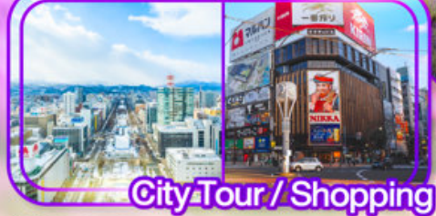
City Tour / Shopping