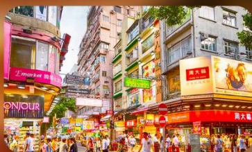
จิมซาจู้