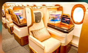
BUSINESS CLASS "บินกลับ"