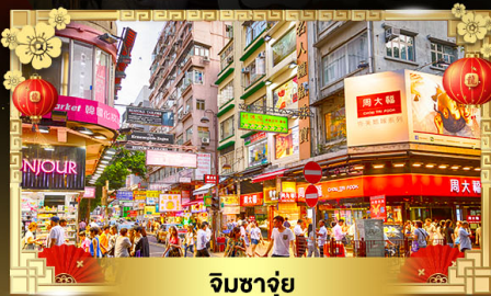
จิมซาจุ่ย