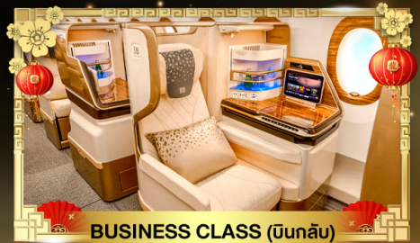
BUSINESS CLASS (บินกลับ)