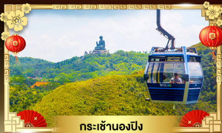
กระเช้านองปิง