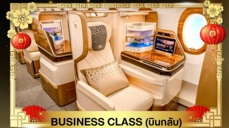
BUSINESS CLASS (บินกลับ)

น้ำหนักกระเป๋า ขาไป 30Kg. | ขากลับ 40Kg.