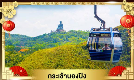
กระเช้าองปิง