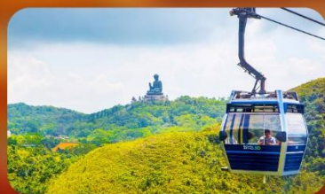
กระเช้านองปิง