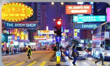
จิมซาจู้