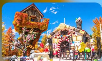
โรงงานช็อกโกแลต ชิโรอิ โคอิบิโตะ