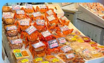
ตลาดปลาโจโก