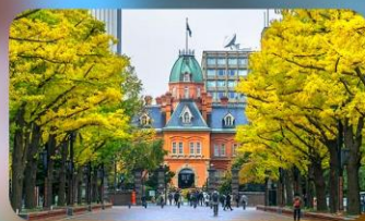
อิสะะตามอัยาศัย 1 วัน