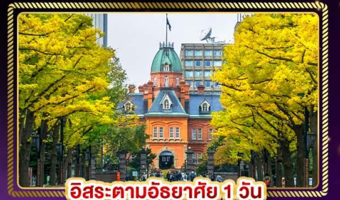
อิสระตามอริยาตัย 1 วัน

น้ำหนักกระเป๋า 20 Kg. บริกตราอาหาร บนเครื่อง ไป-กลับ