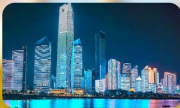
หาดไซเบอร์ฟังก์