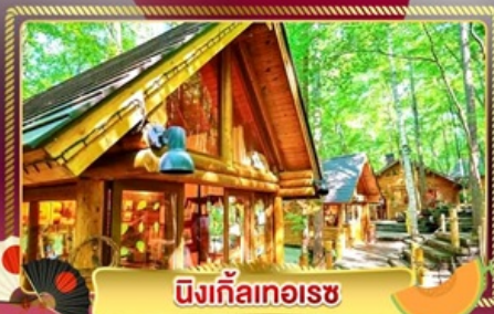
นิงเกิ้ลทอเรซ

ชมทุ่งลาเวนเดอร์ และทุ่งดอกไม้ขึ้นชื่อของฮอกไกโด ฟาร์มโทมิตะ และ ชิโกะไซโนะโอะกะ