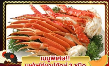
เมนูพิเศษ!! บุฟเฟ่ต์ขาปูยักษ์ 3 ชนิด