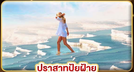
ปราสาทบูยผิวย