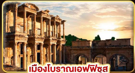
เมืองโบราณเอฟฟุซ