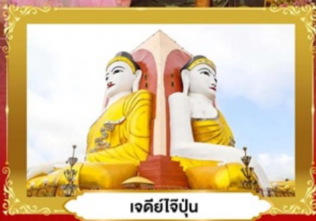
เจดีย์ไฉ่ปุ่น