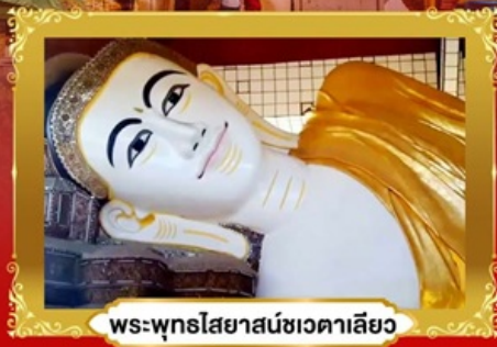
พระพุทธรไสยาสน์ชเวตาเลียว